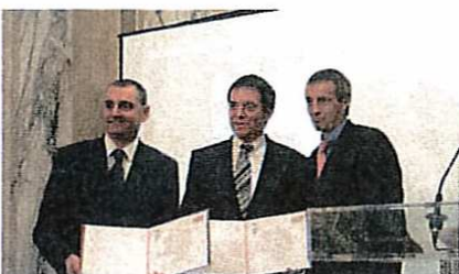
Nominierung - Duropack - Transport- und Verkaufsverpackung für Hächstler.