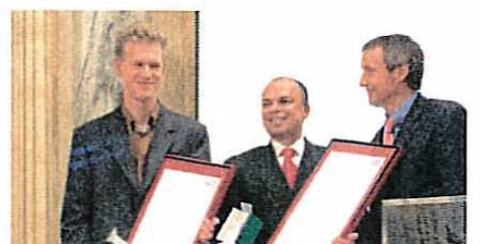
Staatspreis - Alfred Wall - Faltschachtel mit Drehverschluss.