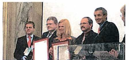
Staatspreis - Mondi Packaging - Kaba.