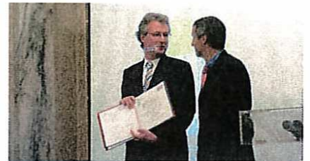
Nominierung - Offsetdruckerei Schwarzach - DVD-Verpackung.