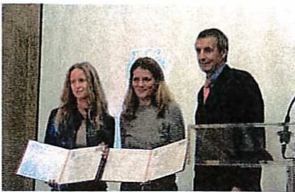
Nominierung - Demner, Merlicek & Bergmann - Vöslauer City Bag.