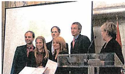
Nominierung - Mondi Flexible Packaging - NeoSteam Pouch.