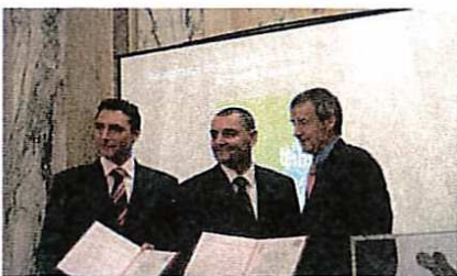
Nominierung - Duropack - Keco Box.