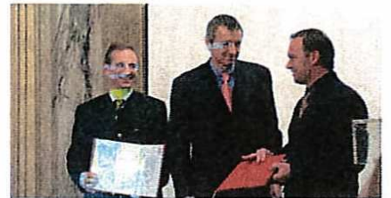
Nominierung - Pirlo - Aromadose.