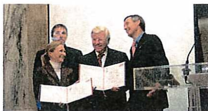
Nominierung - MM Packaging - Rosettenverpackung.