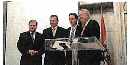
Sonderpreis ARA für ONE von Mondi Bags.